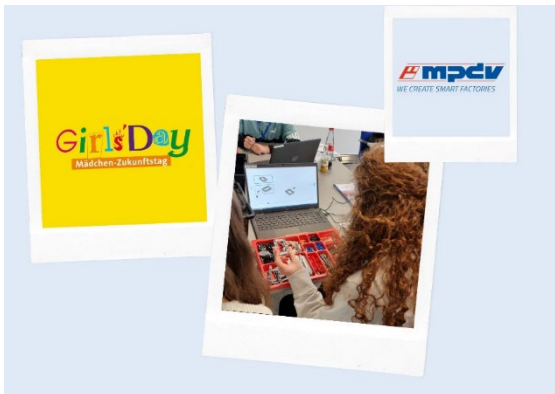
Bild 1: MPDV beteiligt sich am 25. April 2024 am bundesweiten Mädchen-Zukunftstag „Girls'Day“.