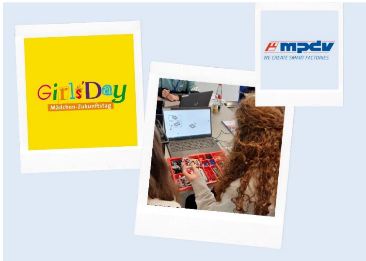
Bild 1: MPDV beteiligt sich am 27. April 2023 am bundesweiten Mädchen-Zukunftstag „Girls‘ Day“.